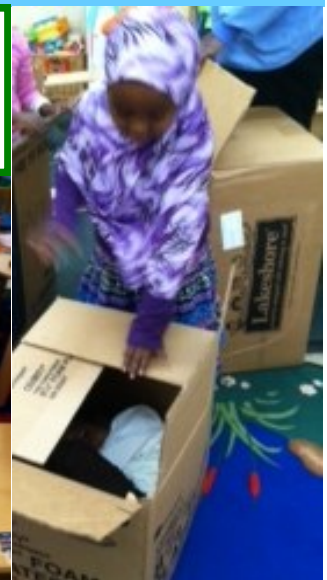
“Investigando una caja”

Dominio 5: Enfoques hacia el aprendizaje – (Explora de manera activa cómo trabajan las cosas en el mundo))