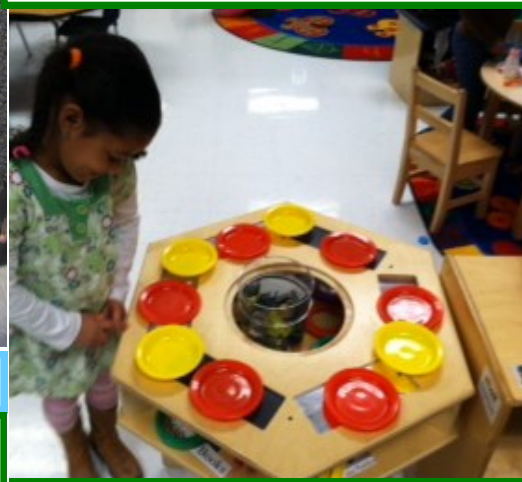
“Poniendo la mesa en el Área de Casa”

Dominio 5: Enfoques hacia el aprendizaje – (Explora de manera activa cómo trabajan las cosas en el mundo))