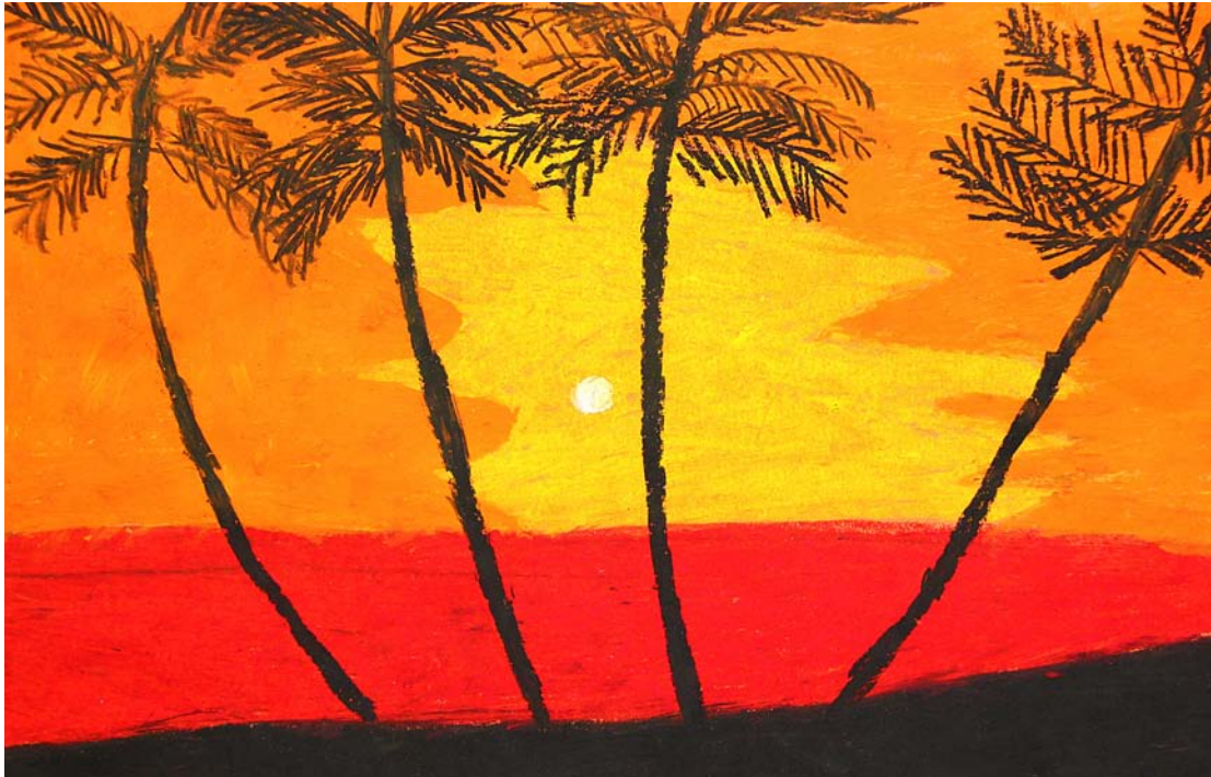
Victoire Hakizimana 5.º Grado Kodak Park Escuela 41