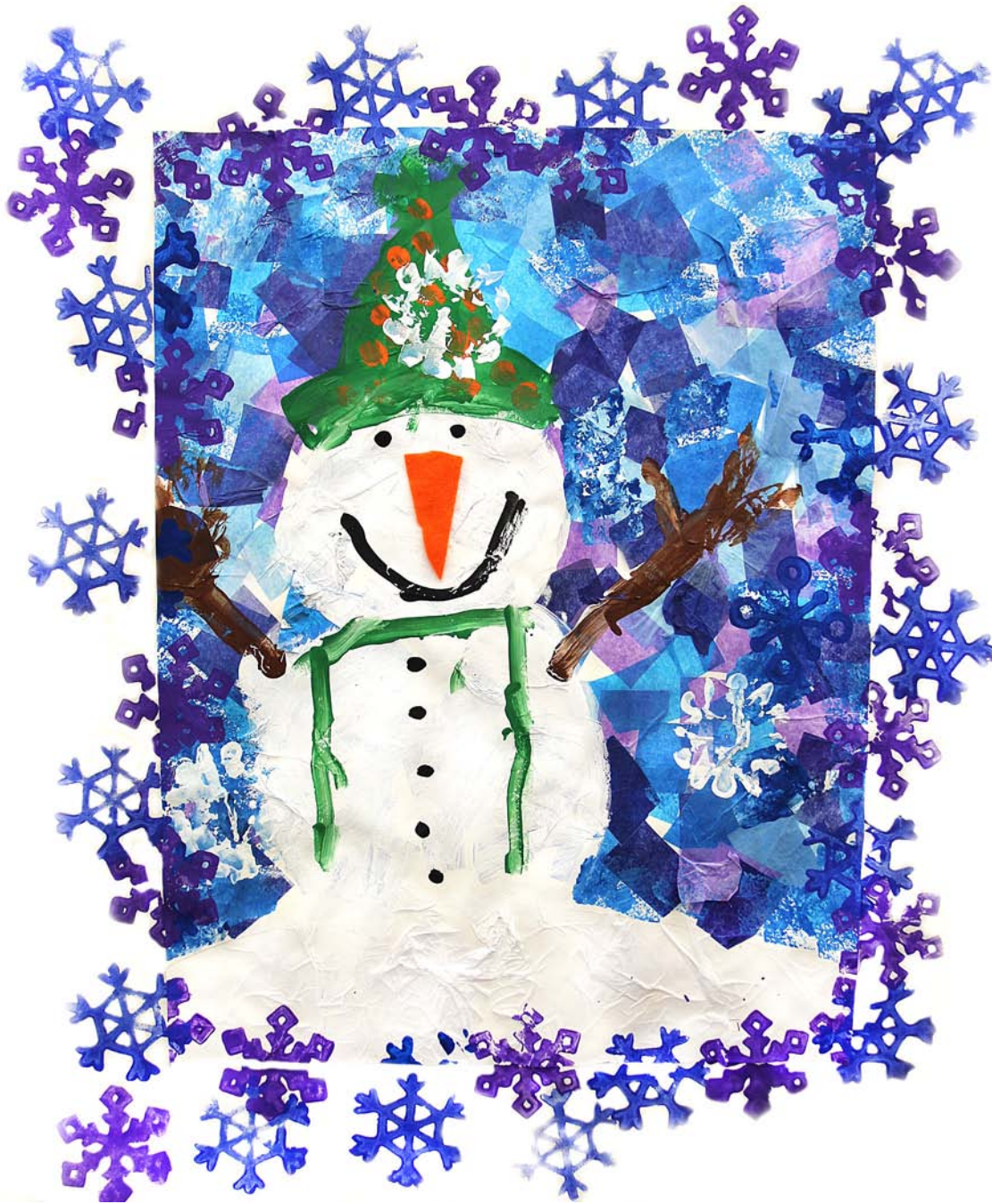
Jerod Peterson 3.º Grado Kodak Park Escuela 41