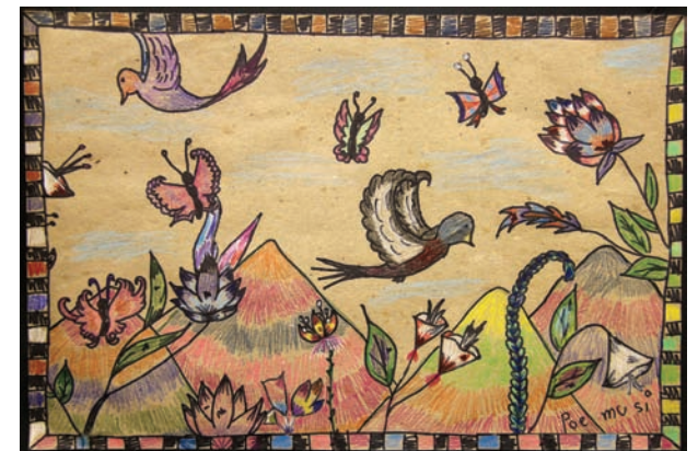
Poe Mu Si 6.º Grado The Children's School of Rochester No. 15